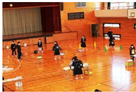
3密を避けた体育館の様子