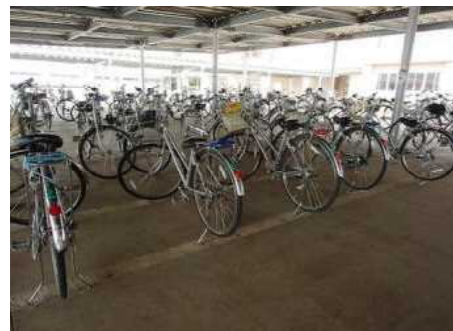
自転車も密を避けて駐輪中