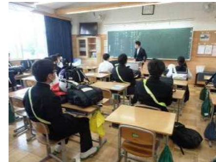
帰りの会であさっての予定を確認