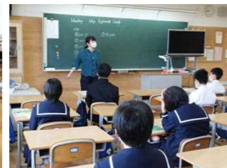
初めての英語の授業(1年)