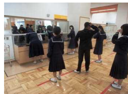
距離を保っての手洗い