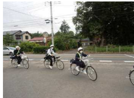
マスクをつけて登校する生徒たち

4月9日(木)から続いていた臨時休業でしたが、5月18日(月)から分散登校による授業を開始しました。各学級を二つのグループに分け、一日おきに午前中3時間の授業を行うことになりました。まずは5月29日(金)まで5教科を中心に学習を進めていきます。前年度までに履修完了していなかった学習内容を含め今年度の学習がスタートします。臨時休業に伴い家庭学習が続いていましたが、その間に進めていた予習の成果を授業で発揮すると共に、帰宅後や自宅待機の日には復習に力を入れながら家庭学習を進めていきましょう。