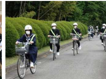
お昼前に下校する生徒たち