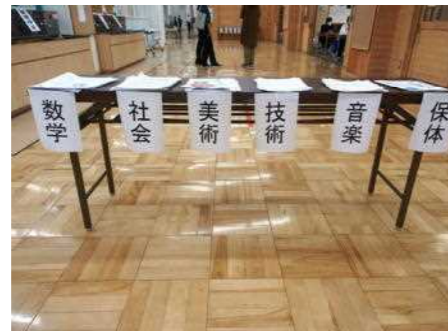
休業中の課題提出テーブル