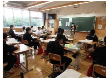
久しぶりの朝の会