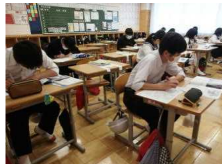
久しぶりの授業に集中