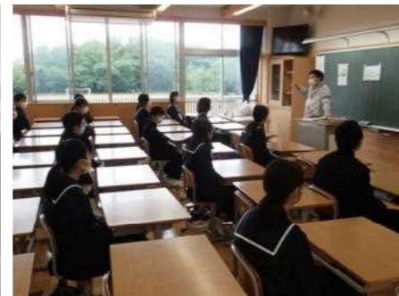
先生の話に緊張して聞く1年生