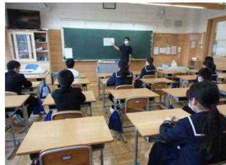
一人おきに着席する生徒たち