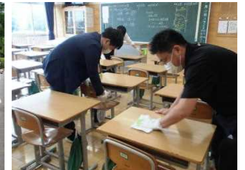
放課後、教室を消毒する先生達