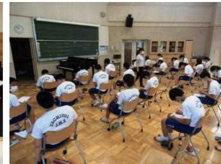
生徒間の距離を離れた授業