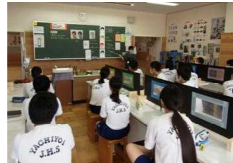
仕切りを設置したテーブル

新型コロナウイルス感染拡大防止のための分散登校が終わり、ようやく6月5日(金)から全校登校を再開しました。今年度、学力向上のために八千代一中で取り組む重点目標は「主体的・協働的な学びや体験活動を通して確かな学力を身に付ける。」であり、そのためにグループによる話し合い活動が重要になってきます。しかし、新型コロナウイルス感染拡大防止の観点から、密を避けるためにグループ学習でなく、一斉形式での授業を進めています。学習課題を的確に把握して授業に主体的に取り組むと共に、家庭学習を充実させ、深い学びに繋げてほしいと思います。