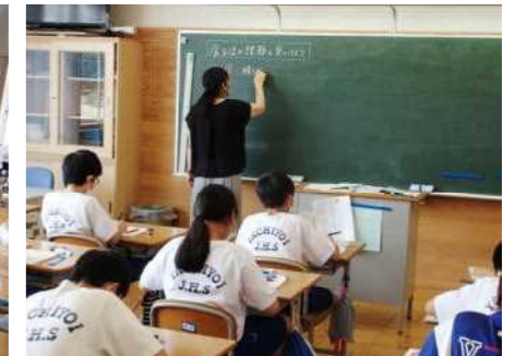
家庭科の授業も普通教室で実施