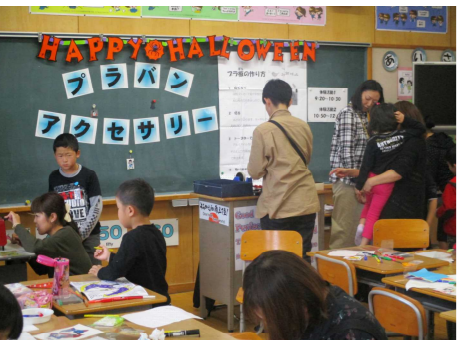
ふれあいフェスタ