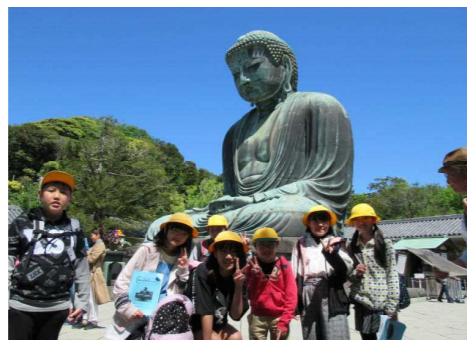
6年生修学旅行(鎌倉・東京)