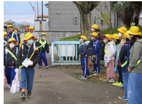
通学班ごとのあいさつ運動