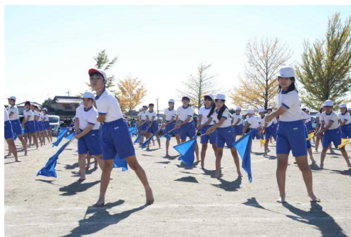
【R3 西小スポーツフェスティバル】

1年生は入学、他の学年は進級して約1カ月が過ぎました。子どもたちの様子から、新しい教室、新しい友達、そして、新しい先生にも慣れた様子がうかがわれます。また、保護者の皆様には、授業参観、紙上でのPTA総会、家庭確認等にご協力をいただき、ありがとうございます。